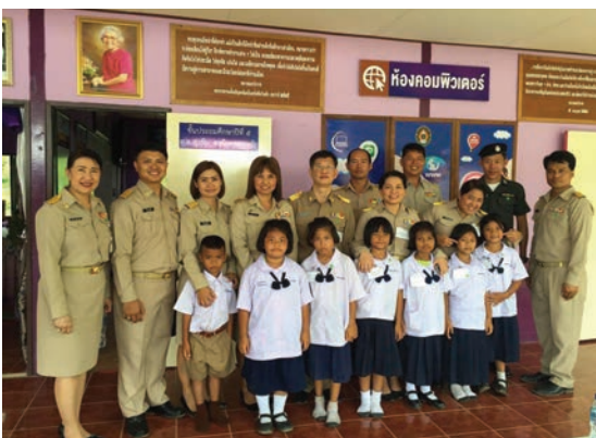
บุคลากรร่วมเฝ้าฯรับเสด็จ