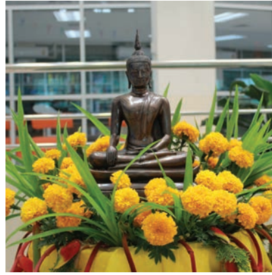
สงฆ์น้ำพระพุทธรูป