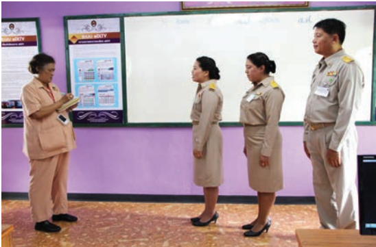
ถวายรายงานการดำเนินงาน