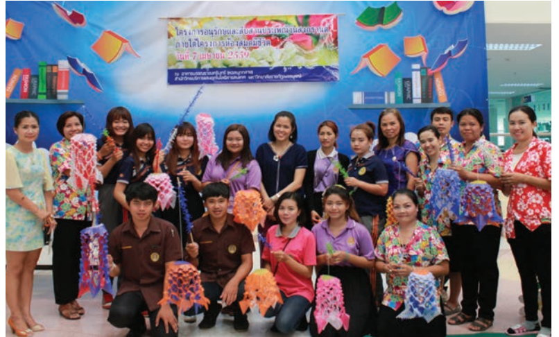
ผู้เข้าร่วมประดิษฐ์ตุ๊กไล่หมี